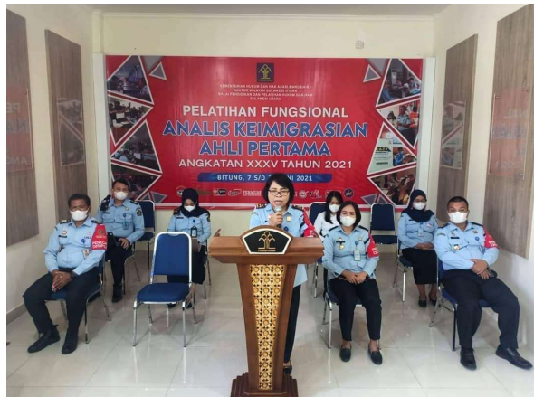
Analisis Keimigrasian Ahli Pertama